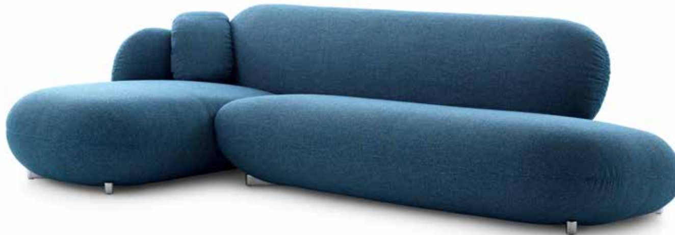
Leolux Pulla Design: Studio Truly Truly, 2021